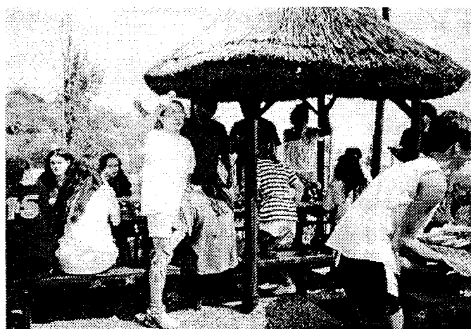
ENGEM IS KIHAGYTAK A SZAKNÉVSORBÓL!