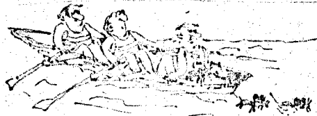
Vedami baj van egyedele...