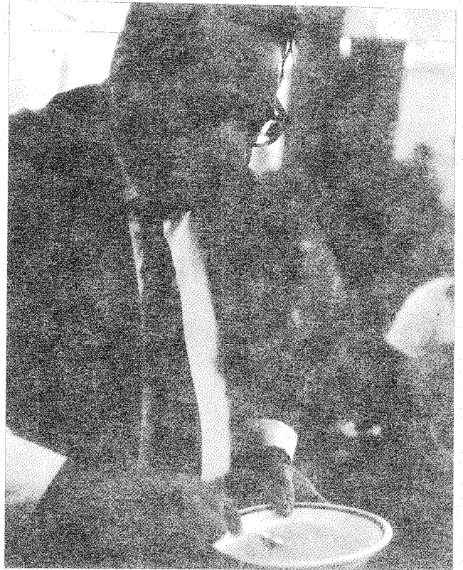
Ő verte legkeményebbre