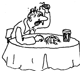
Szeret, nem szeret

Azért csak „tűnik”, mert ezt sem használjuk ki. Október 3-án délutánra karunk megkapta a MAFC létesítményeit. Ezen a délutánon mindenki megtalálhatta volna a számára legjobban megfelelő sportolási lehetőségeket.