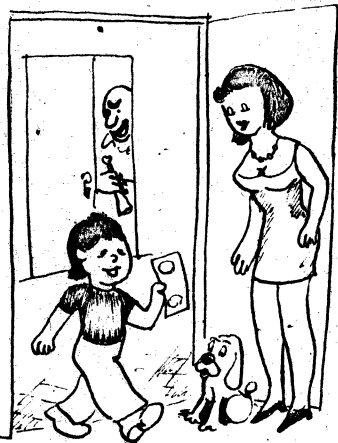
Érted ezt Mami, a szomszéd egy szá- zást adott a régi trombitáért!