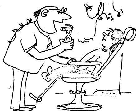
NA LÁTOD, A FOGHÚZÁS EGYÉLTALAJ NEHÉZ!