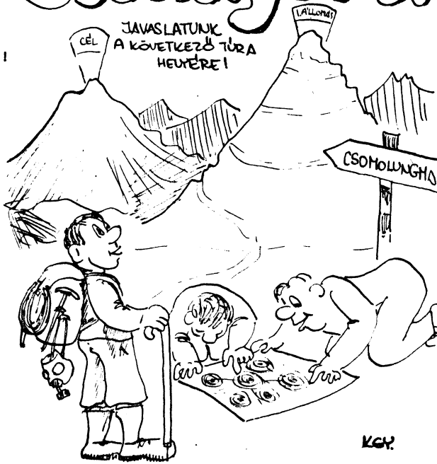
Ezuton mondunk köszönetet a csillagtúra szervezőinek a kellemesen telt, vidám napért!

Aztán jött az "igazi túra"! Egy újabb "csillag"! Hogy miért? Gyorsan elarulom. Apró kis emlékedekkel tarkított volt az út. No, de ezt is kibirtuk! Mi sem mutatja ezt ékeesebben, hogy 24 csapat jutott el a célhoz.